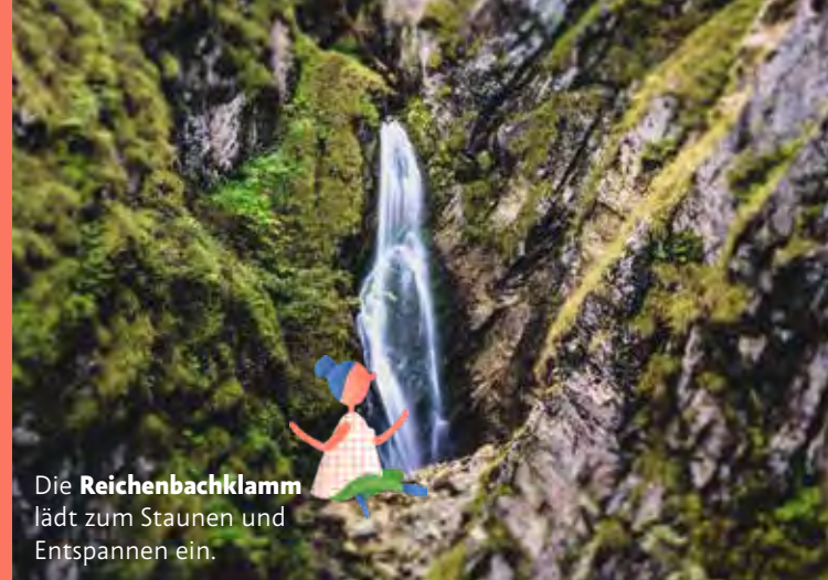
Die Reichenbachklamm lädt zum Staunen und Entspannen ein.

Telefon +49 83 63/58 20 info@breitenbergbahn.de facebook.com/Breitenbergbahn www.breitenbergbahn.de