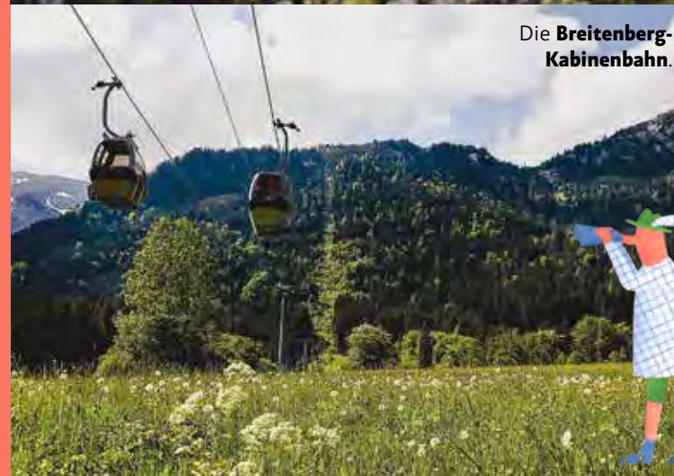
Die Breitenberg-Kabinenbahn .